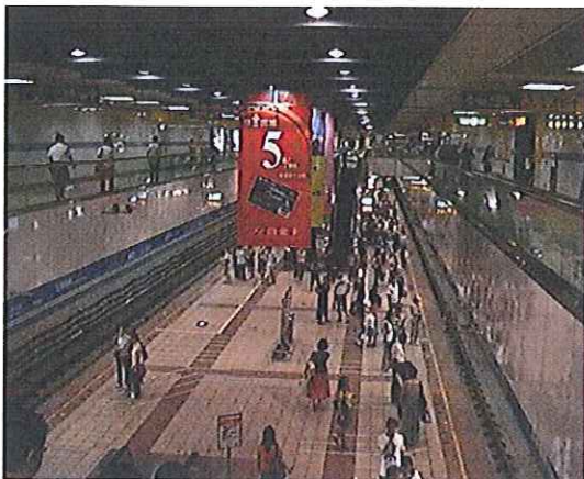
圖 1 臺北捷運南港線忠孝復興站

在台北捷運完成多條路線，同時在工程管理上累積足夠的經驗，再加上國內廠商累積相當的工程技術與經驗，基於減少工程界面及降低管理人力，藉由擴大工程規模提高國際廠商競標意願以節省工程經費等等因素，將後續開工的板橋線第二階段暨土城線、新莊線暨蘆洲支線、內湖線、南港東延段、信義線以及松山線均以此種區段標方式發包。【標楷體，字型大小為 12 點字。第一行縮排兩個字元，與前、後段距離為 0.25 列，左右對齊、單行間距。文中數學公式，依序編號，例如：(1)、(2)；正文內註明出處時的寫法：中文作者如(黃仁宇, 1981)，(黃紀與黃樹仁, 1979)，英文作者如(Firth, 1951)，(Lynch & Rowin, 1958)。作者三人(含)以上，中文如(龔永香等, 2007)，英文如(Dotzour et al., 1998)】