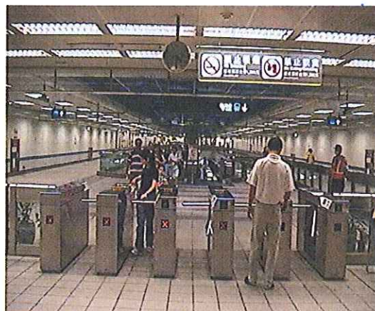
圖 2 臺北捷運板橋線江子翠站

【所有章、節及圖之編號一律使用一、(一)、1、(1)；英文文稿之章節編號則使用 1、1.1、1.1.1。】