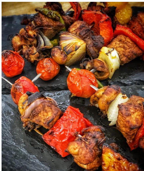
西班牙式豬肉串燒