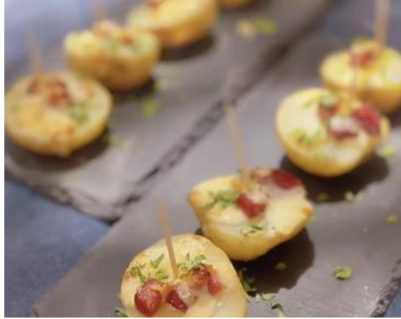
陳年高達起司焗洋芋