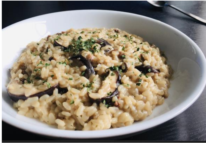
義大利牛肝菌燉飯